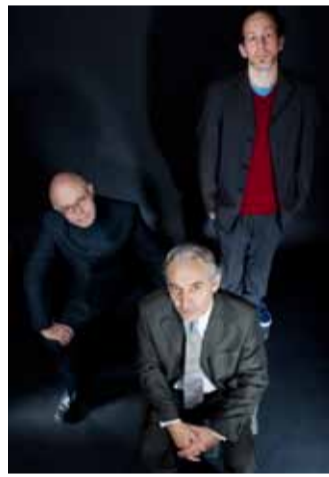
Toby Tiger and the Kings of Jazz