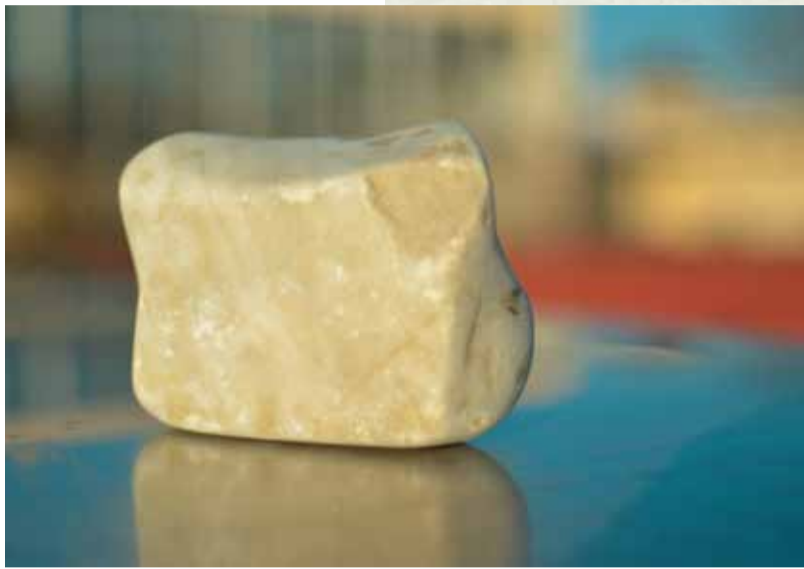
Vom Stein zum Byte