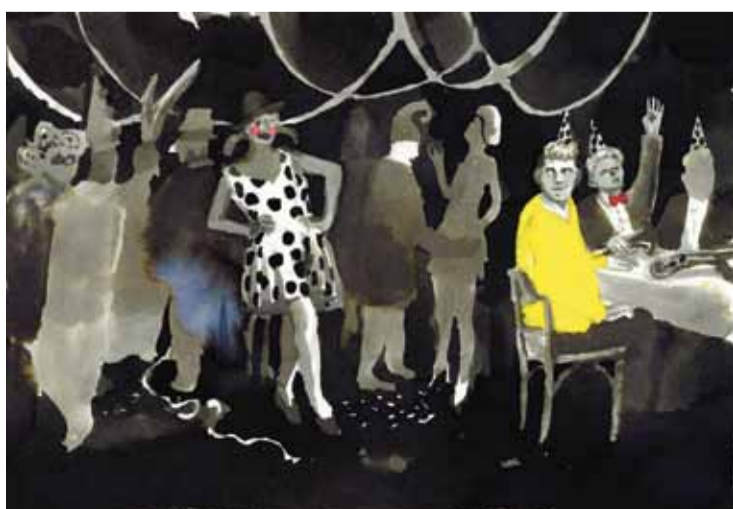
Wysel – eine lüpfige Bildreise durch die Flegeljahre der Ländlermusik